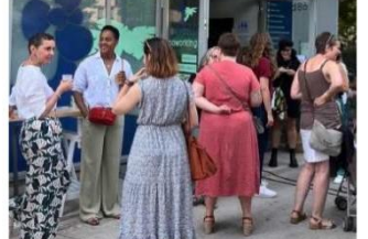
Un petit-déjeuner a eu lieu dans l'espace de coworking.