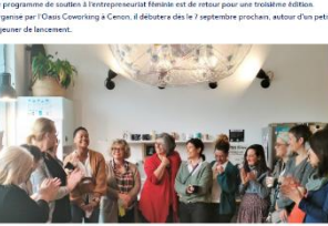
Le programme de soutien à l'entrepreneuriat féminin est de retour pour une troisième édition.

Ce programme de soutien à l'entrepreneuriat féminin est de retour pour une troisième édition. Organisé par l'Oasis Coworking à Cenon, il débute dès le 7 septembre prochain, autour d'un petit-déjeuner de lancement.