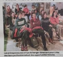
Les entrepreneures se pouvaient librement pour créer des liens professionnels et des opportunités futures.