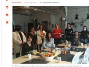
Le programme de soutien à l'entrepreneuriat féminin est de retour pour une troisième édition.